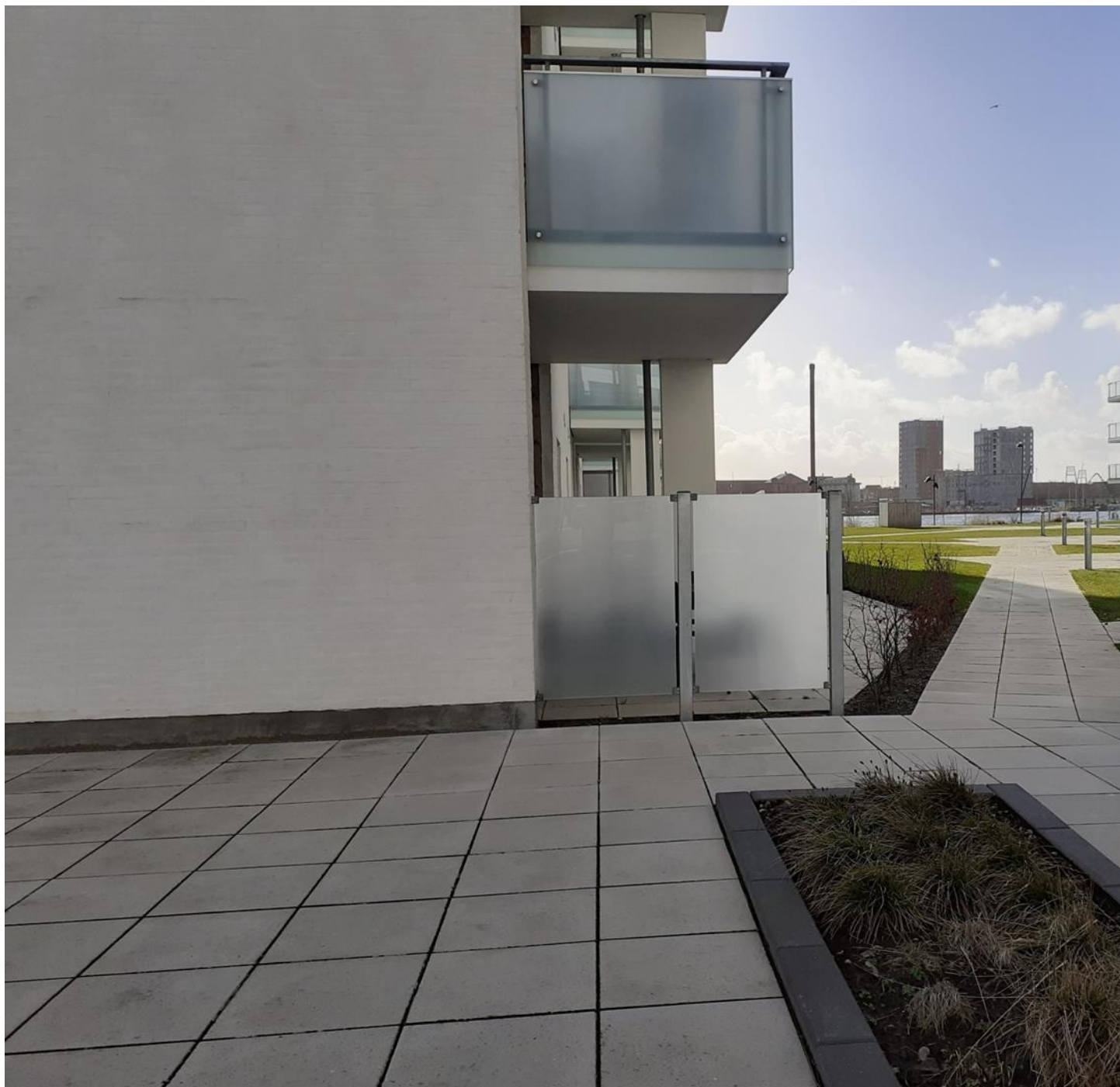
Fig. nr. 5