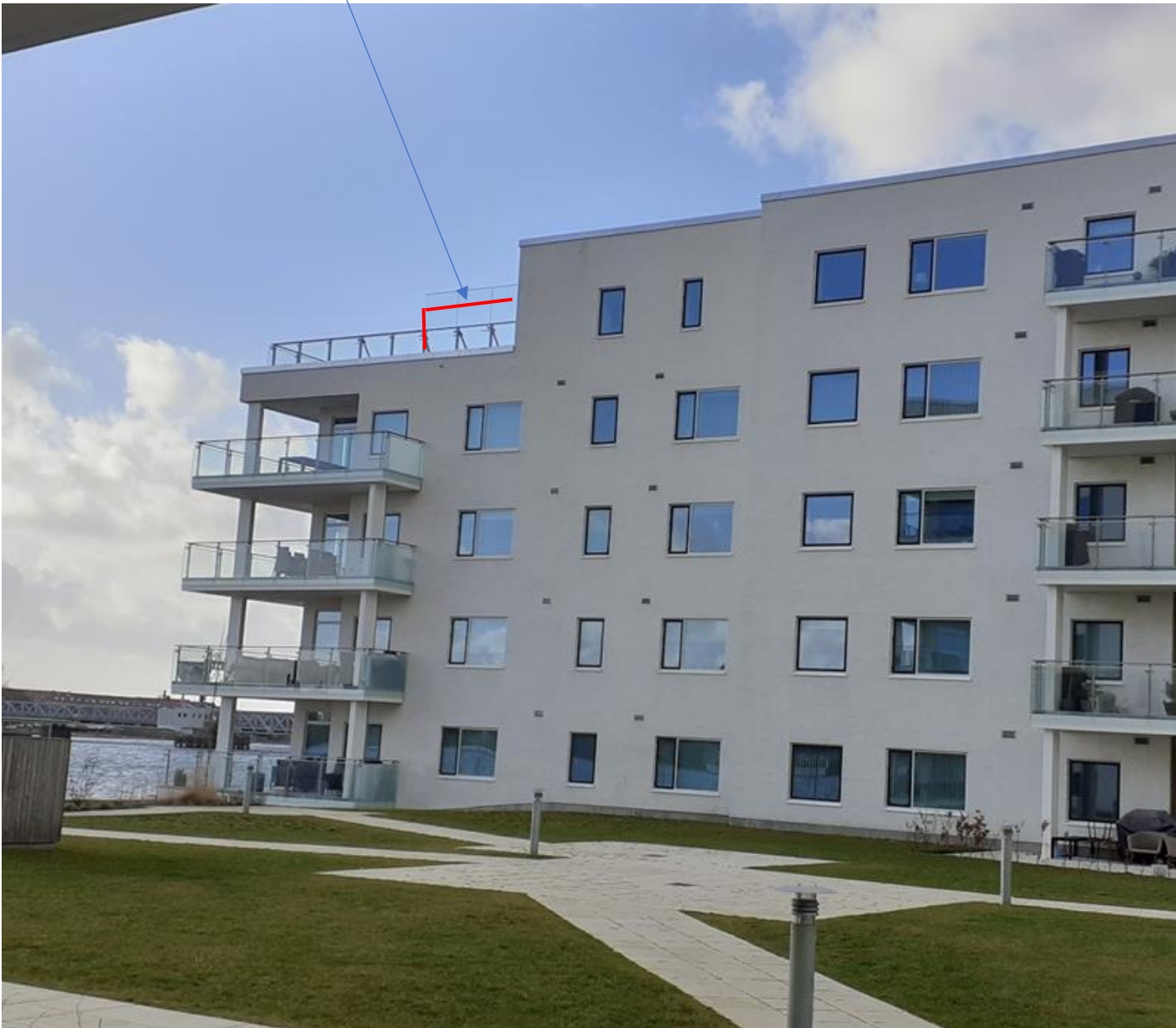
Fig. nr. 6

Oprindeligt opsat forhøjet vindafskærmning kan udvides med 2 fag.