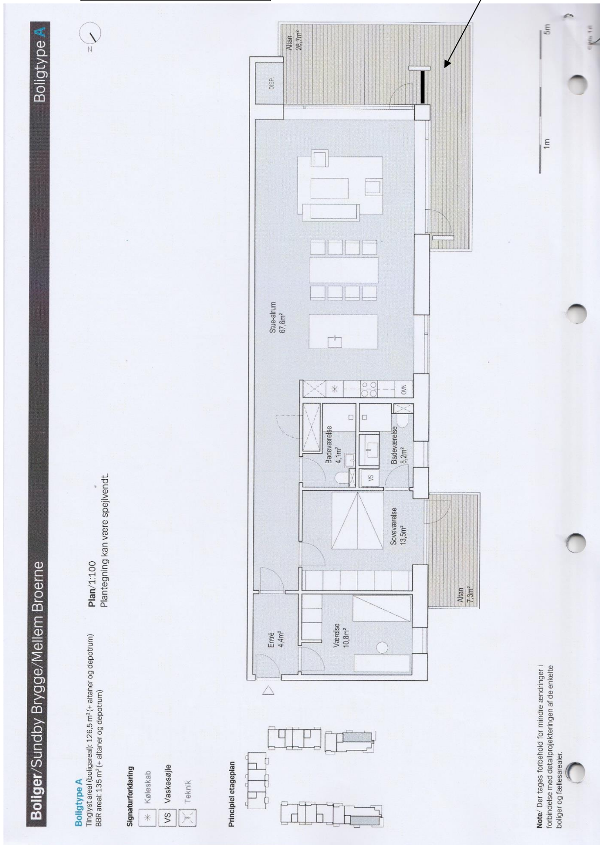
Fig. nr. 1